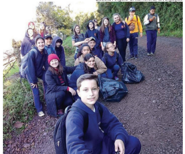
Escola Angelo Chiamolera, divulgação