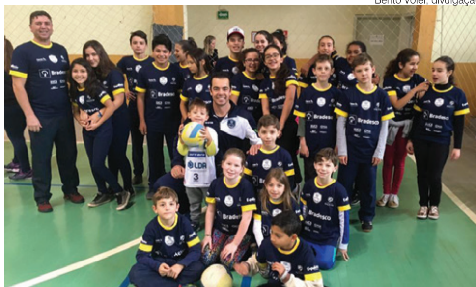
Bento Vôlei, divulgação

Fortemente comprometidos com a promoção do bem-estar social da comunidade onde está inserido, CIC-BG/ExpoBento contribuem de forma ativa com diversas promoções assistenciais e suporte ao trabalho de entidades idôneas que atuam no município. Em 2016, projetos como Leãozinho do Bem, Sonho de Menina Moça, Ação entre Amigos, Padrinhos na Escola foram diretamente beneficiados. Também diferentes entidades (Abraçáí, Lar do Ancião, APAC, APAE e Liga de Combate ao Câncer, entre outras), receberam doações para a manutenção de suas atividades.