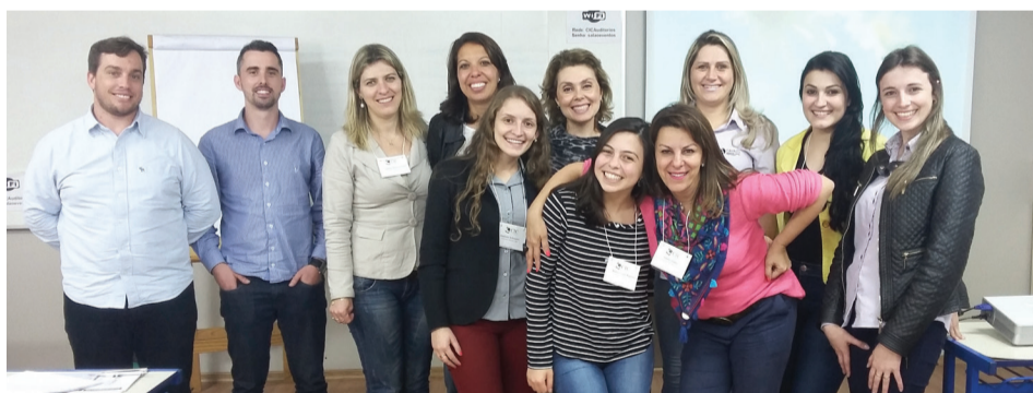
Turma de atendimento ao cliente