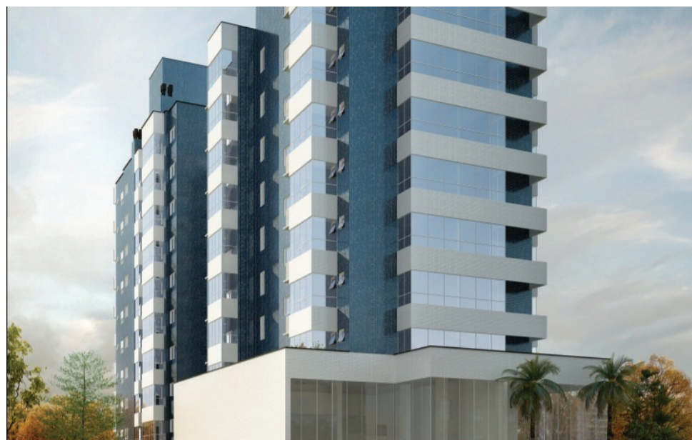
Moinhos Cidade Alta, umas das melhores vistas da cidade

A localização do empreendimento inspirou o nome do projeto com uma das melhores vistas da cidade. O Moinhos Cidade Alta apresenta arquitetura e proposta diferenciadas, adequadas a uma sociedade em desenvolvimento, que procura qualidade de vida, bem-estar, num lugar que combina felicidade e praticidade.