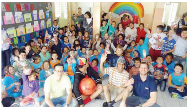
Parceiros voluntários realiza ações com a comunidade

Nessa relação de troca, todos os envolvidos saem ganhadores. As ações são positivas também para quem ajuda, uma vez que a participação nas atividades desenvolve maior envolvimento com a comunidade. “Muitos relatam que se descobrem voluntariando: dedicando-se ao próximo, eles também recebem a troca desse calor humano, tornando-se cidadãos mais conscientes e